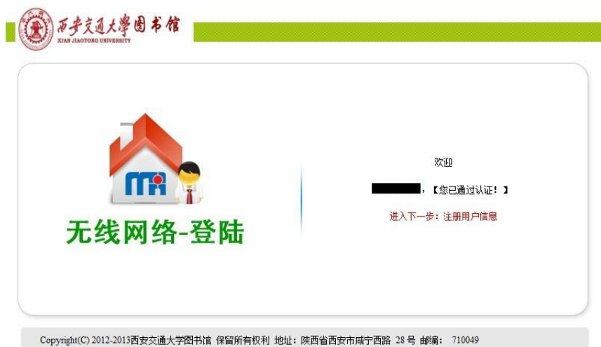
图 3 认证成功页面