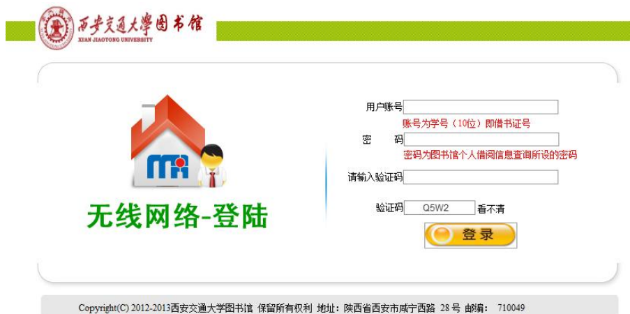
图 2 认证页面