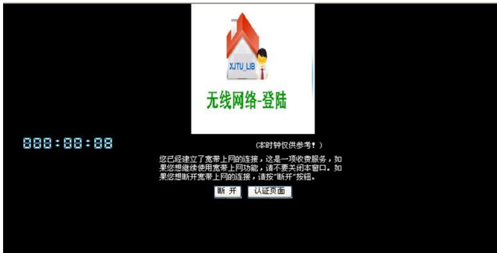
图 7 无线网登陆成功页面