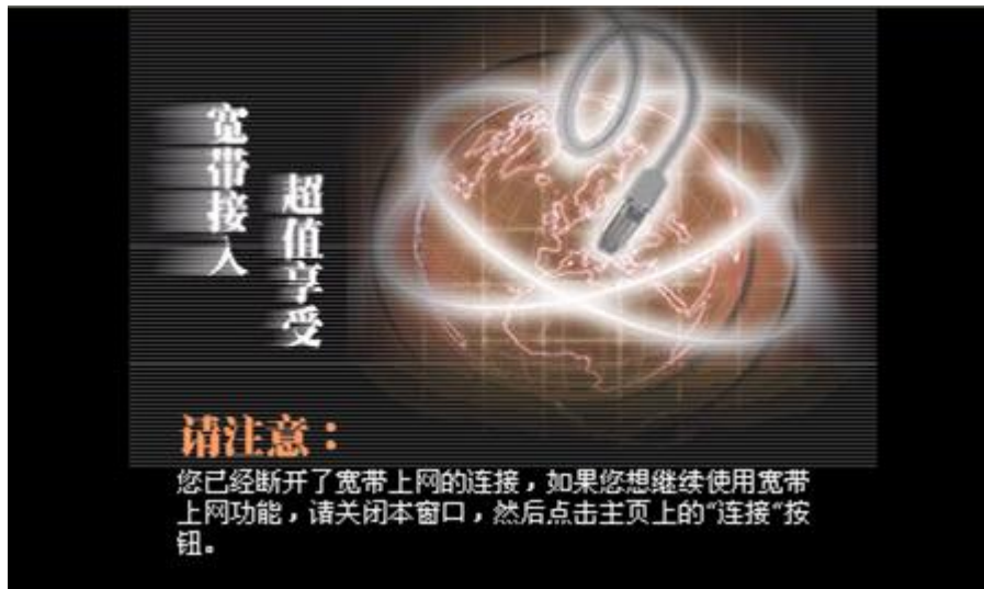
图 8 断开无线网后提示页面