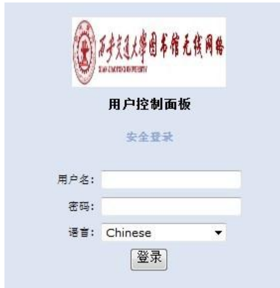
图 9 用户控制面板