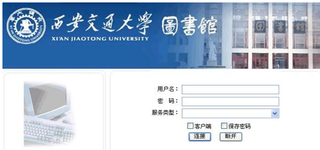
图 6 无线网络登陆页面